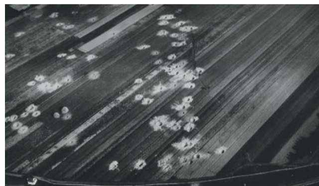
Wrzesień 1939. Leje bombowe nad Bzurą.