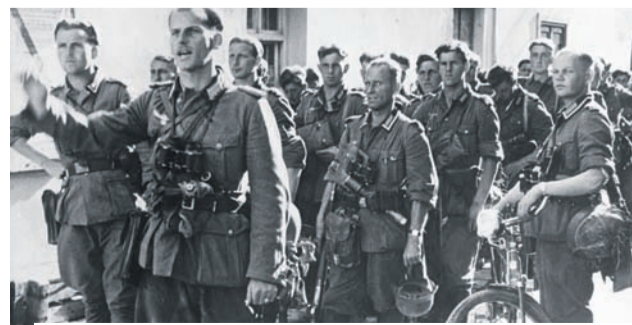
Mysłowice, 3 września 1939. Wkroczenie oddziałów niemieckich.