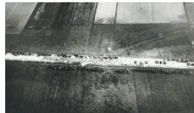
Wrzesień 1939. Kolumna wojsk niemieckich.