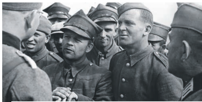
24 września 1939. Niemiecki oficer w rozmowie z polskimi jeńcami.

Agresja sowiecka czyni sytuację Polski beznadziejną. [...] Wejście na scenę żołnierzy Stalina, którzy przynajmniej w rejonie Tarnopola posunęli się dosyć szybko, stawia niezwłocznie rząd i armię polską w najgorszym położeniu. [...] Jest to fakt godny ubolewania, symbolizujący koniec Polski Piłsudskiego lub, co najmniej, jego zbyt pewnych siebie uczniów.