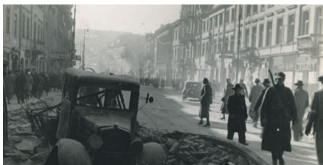
Warszawa, początek września 1939. Ul. Nowy Świat po nalotach bombowych.