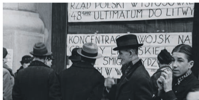
Kraków, marzec 1938. Komunikat o ultimatum wystosowanym przez rząd polski do rządu litewskiego.