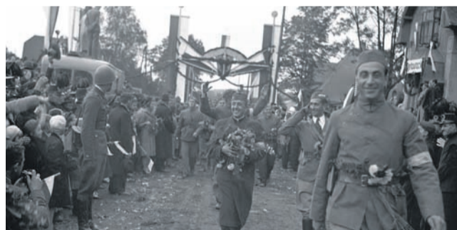
Karwina, październik 1938. Delegacje polskich organizacji społecznych na defiladzie po zajęciu Zaolzia.