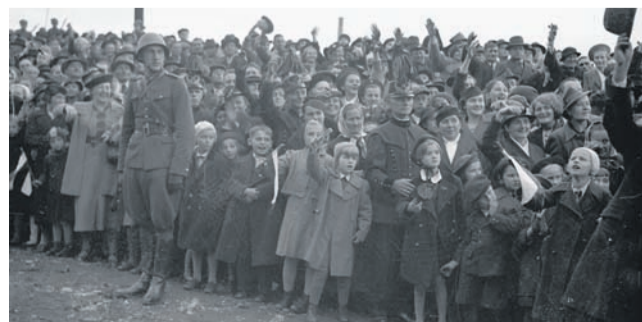
Karwina, październik 1938. Polscy mieszkańcy miasta podczas defilady po zajęciu Zaolzia.