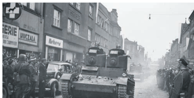
Czeski Cieszyn, październik 1938. Defilada polskich wojsk po zajęciu Zaolzia.