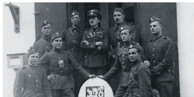
Ligotka Kameralna, październik 1938. Polscy żołnierze z czeskim godłem zdjętym z urzędu pocztowego.