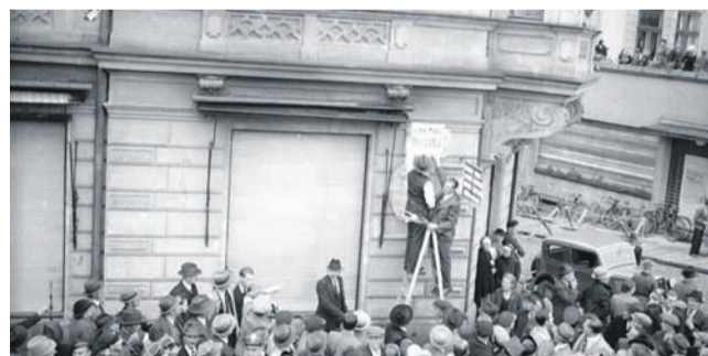
Czeski Cieszyn, październik 1938. Wieszanie tabliczki z nazwą ul. Józefa Piłsudskiego po zajęciu Zaolzia.